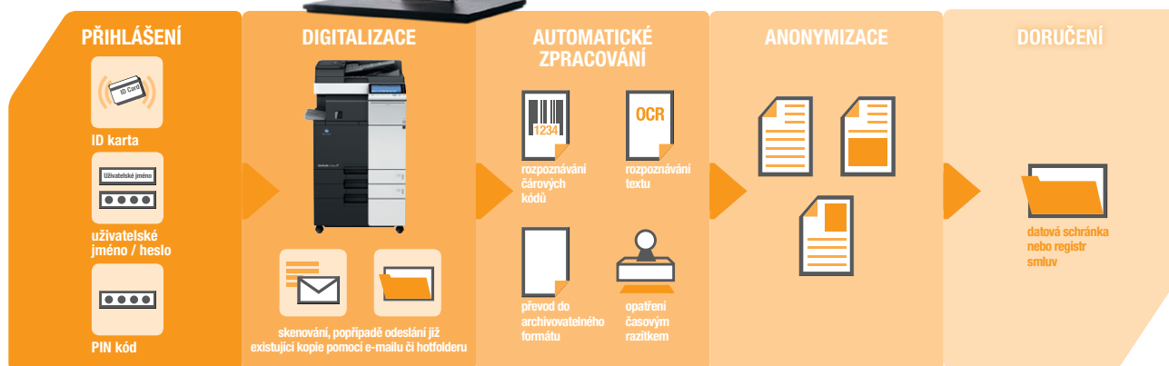
Pracovní postup anonymizace

Smlouvu určenou k anonymizaci lze skenovat na stroji Konica Minolta nebo na jakémkoliv jiném multifunkčním zařízení či dokumentovém skeneru. Samozřejmostí je i možnost poslat smlouvu e-mailem nebo vložit přes vstupní složku. Lze zpracovávat soubory typu PDF, JPEG, JPG a TIFF.